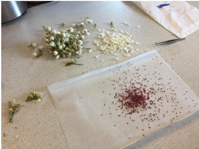
Innsamling av pollen